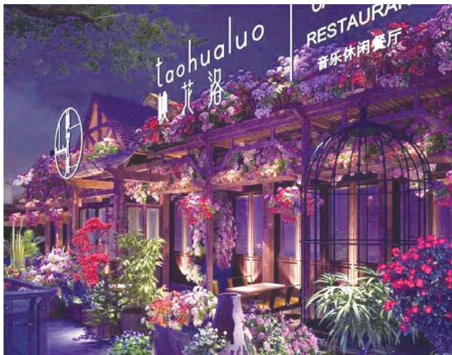
图一:桃花洛音乐餐厅

作为一家高品质餐厅,餐品自然备受瞩目,桃花洛主张健康餐食、合理搭配,摒弃传统油腻、多肉的菜品风格,选用地道新鲜食材,通过高级厨师的精心烹调,最大限度保留食物营养和美味,排除饮食对人体所产生的不利影响,真正实现做得精致用