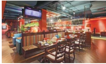
图三:孔雀音乐餐厅