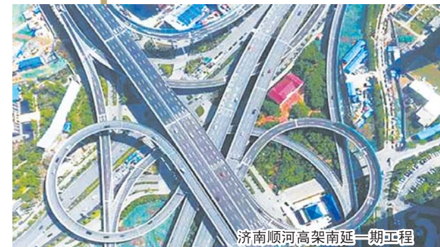
济南顺河高架南延一期工程