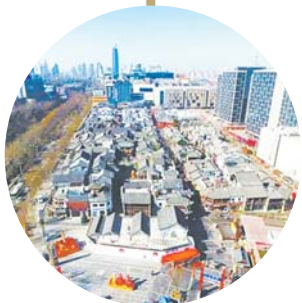
济南市中心泉城路附近的宽厚里改造一新