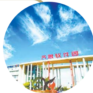
位于济南高新区的齐鲁软件园,已成为济南高新产业重要聚集地