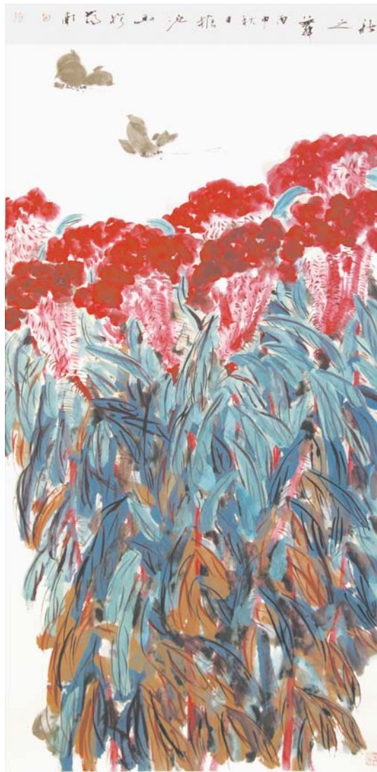
《秋之舞者》134 × 68cm