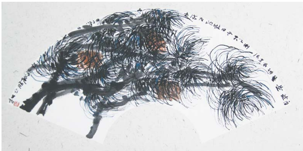
《松风》25 × 45cm