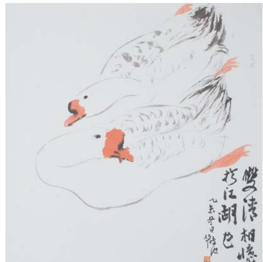
《相依赖于江湖》34 × 34cm