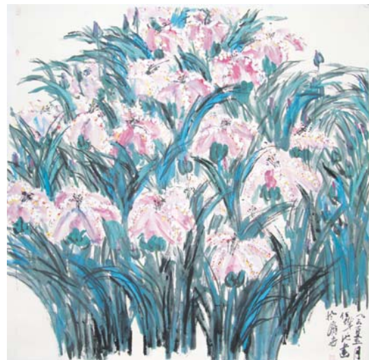
《鸂尾》134 × 134cm