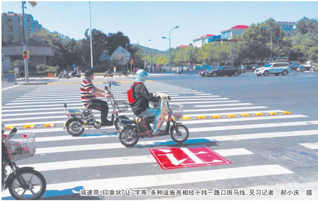
减速带、印章状“让”字等,多种设施亮相经十纬一路口斑马线。

今年5月起,济南交警开展路口交通秩序整治行动,人脸识别抓拍系统、大屏幕实名曝光……多种新科技整治措施频出,路口交警、协管员、志愿者轮番上阵维护秩序,行动开展70多天以来,机动车不礼让斑马线的违法率下降79.3%,行人通行效率提高了20%,这一现象被央视、人民日报称赞为值得全国推广学习的“济南式过马路”。