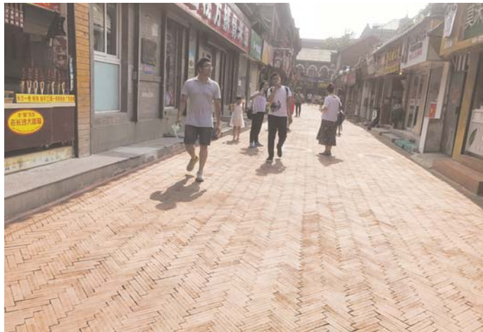
行人走在新铺设的红砖地面上。

目前只有芙蓉巷的地面换成了红砖,芙蓉街主路仍然是青石板路。“下一步也会进行整修,统一由明府城实施,目前只是加固松动石板。”济南市泉城路街道办事处城管科科长张现水说。