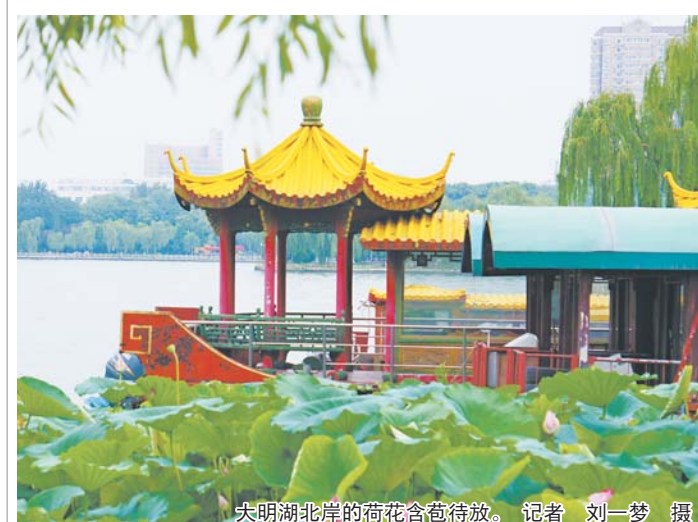
大明湖北岸的荷花含苞待放。

近日,山东省人民政府在印发关于山东省“十三五”节能减排综合工作方案,根据规定今年9月底前,济南、淄博、济宁、德州、聊城、滨州、菏泽7市全部供应符合国六标准的汽柴油,禁止销售普通柴油。“加油站换油需要把油箱内国五标准的油品清空后重新加入国六标准的油品,但是汽车国五换国六油品是可以混合的。”济南市解放东路中石油加油站的工作人员说,市民不需要清洗油箱油路,加过几次油之后,就会完成过渡。而对于价格,工作人员说,按市场情况来看,升级后的国六标准的油品价格不会有太大的变化。见习记者 刘紫薇