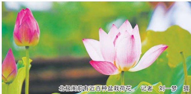
北极阁前有近百盆栽荷花。