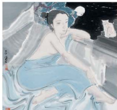
《依窗观猫》 68.5 x 69.5cm