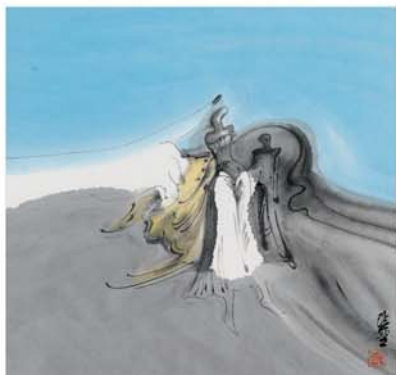
《触摸之六》 35 x 45cm