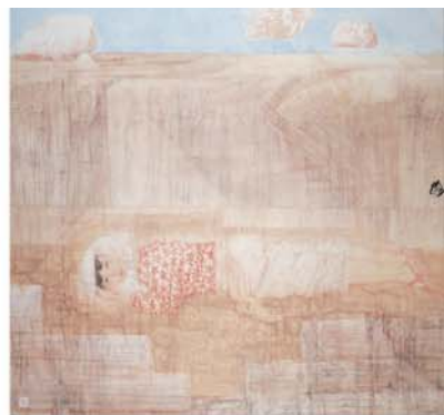
《麦子》 189 x 190cm