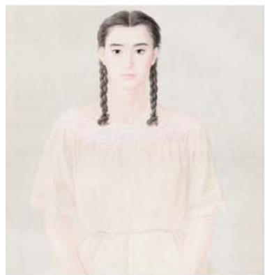
《笛》 62 x 85cm