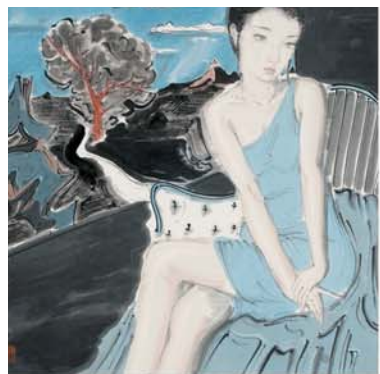
《碧天青云》 68.5cm x 68.5cm

山东有线出品的电视专题美术片《时代美术》已在省内各地市导视频道陆续播出,省导视0号频道播出时间为23:00,各地市导视频道播出时间为15:00/22:30。