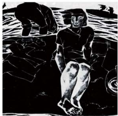
《小溪·摇篮》黑白木刻 37 x 50cm