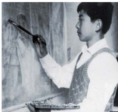
1975年初中时为学校画壁报