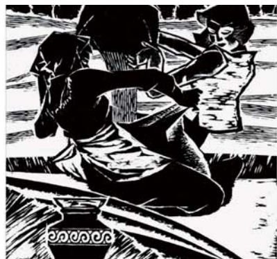
《金秋》黑白木刻 30 x 36cm