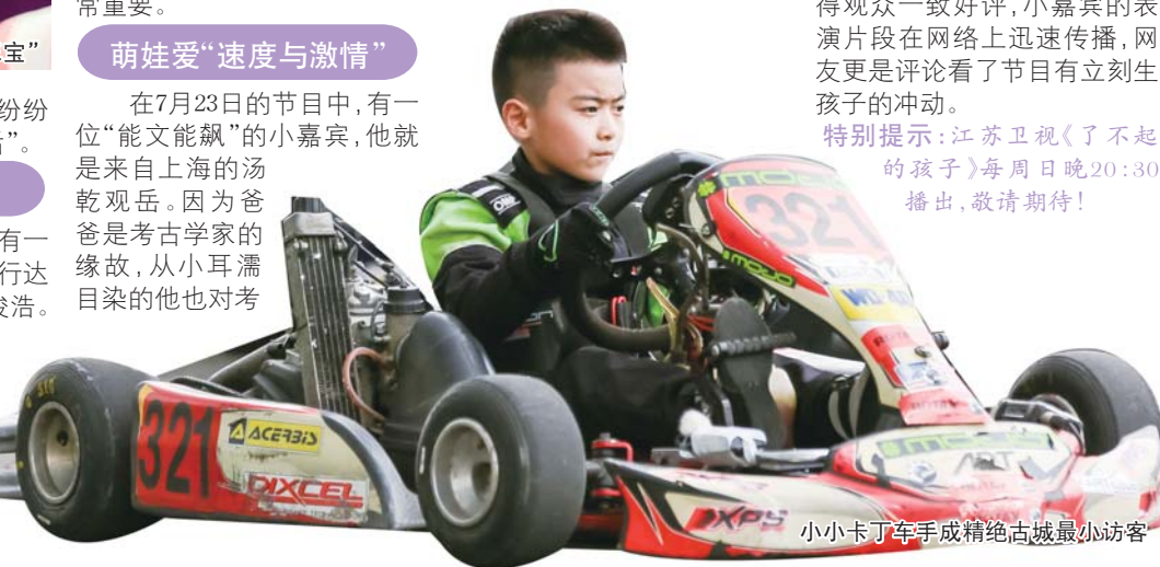
小小卡丁车手成精绝古城最小访客