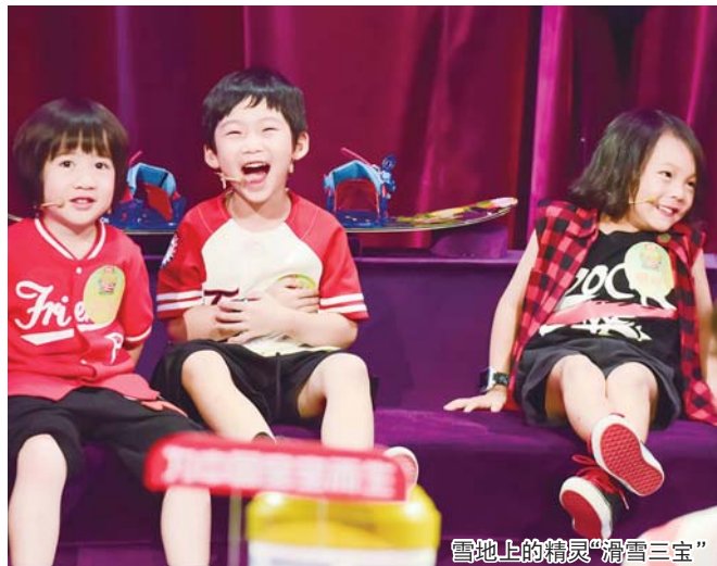
雪地上的精灵“滑雪三宝”

江苏卫视《了不起的孩子》在7月23日晚第三期播出后收获话题与收视双丰收!收视率持续攀升到新高的0.98,同时段综艺排行第一,节目视频网络总点击量突破7400万,微博话题阅读量升至2.6亿,霸占综艺榜第一!