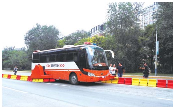
旅游路上,“拉链车”正在“吞吐”隔离墩。