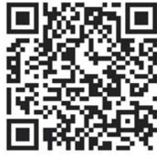
扫二维码查看 “食安山东”全部示范单位名单

公示期自即日始至8月18日,对上述单位有意见的市民,可以通过拨打电话0531-88592615或发送邮件到zhaolong@sdfda.gov.c的方式向省食安办反映。