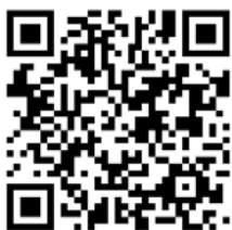
扫二维码查看 首批齐鲁名师名校长名单

除此之外,此前评出的首批齐鲁名师名校长名单已在省教育厅网站公布,共计92人。 记者 刘一梦 通讯员 王占波