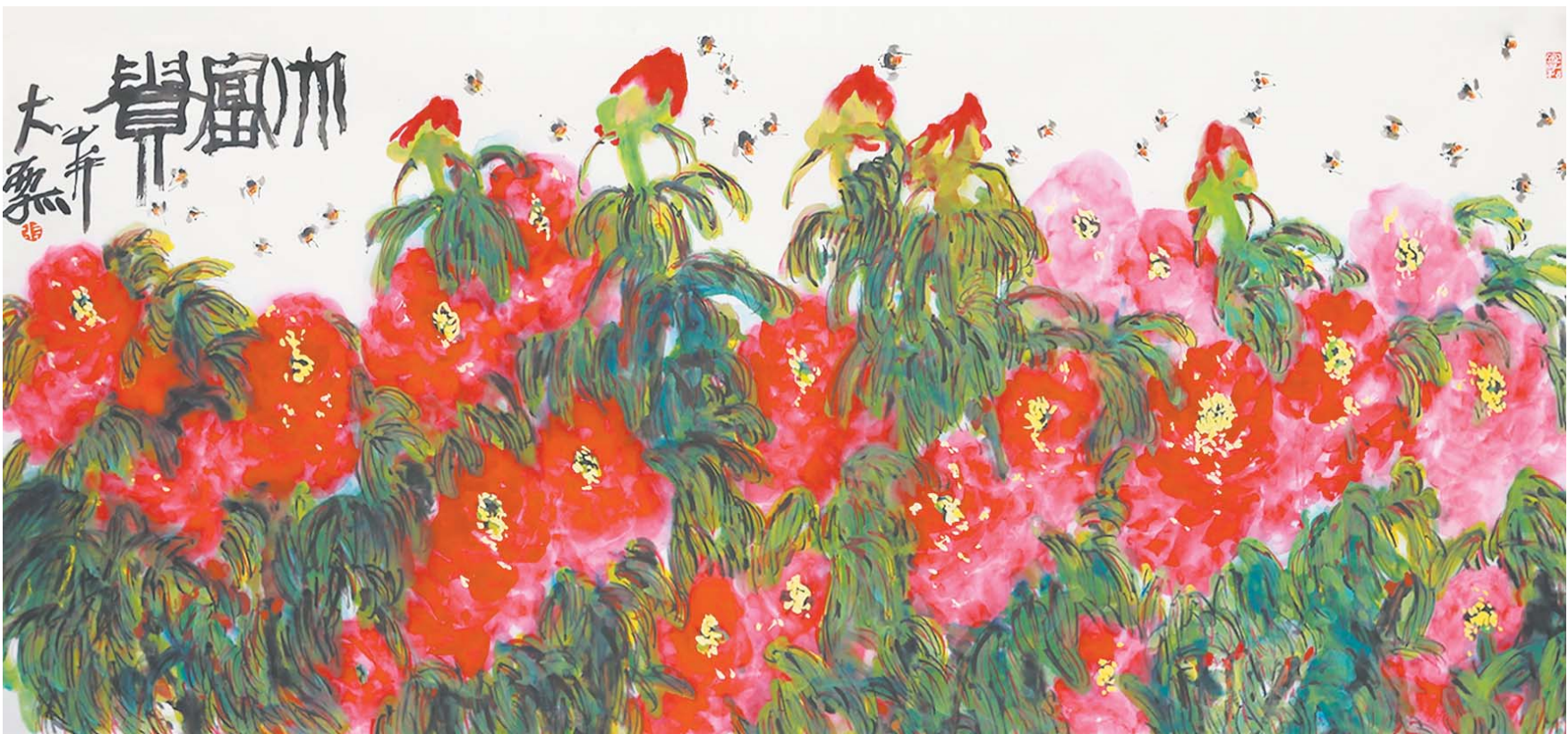
▲张锡杰 《大富贵》 180 × 90cm