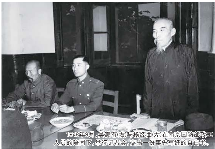
1948年9月,吴满有(右)与杨经曲(左)在南京国防部政工人员的陪同下,举行记者会,交出一份事先写好的自白书。

对今天不少读者而言,吴满有是一个陌生的名字。可在抗战时期的陕甘宁边区,劳动英雄吴满有可谓家喻户晓。他的名字在《毛选》、《邓选》中被多次提及,还写入了中共中央文件。边区农业战线的“吴满有运动”和工业战线的“赵占魁运动”,使两人成为大生产运动的两面旗帜。吴满有是毛泽东的座上宾,毛亲笔为他题词:“天下有名”。然而就是这样一位“红色英雄”,却在1948年的解放战争中被国民党军队俘虏,国民党电台发表了他的“反共讲话”。最后,吴满有被开除党籍,身败名裂,郁郁而终。他昔日的“辉煌”,也在建国后很少被提及。从大英雄到战俘,吴满有书写了戏剧般的人生。