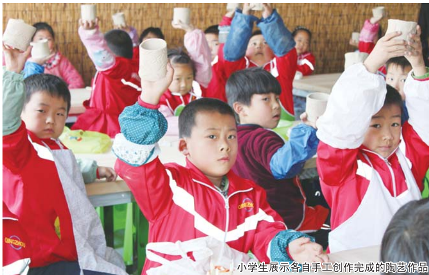
小学生展示各自手工创作完成的陶艺作品

为了让学生们更快体验到陶艺乐趣,学校从简单、易操作的泥杯开始学习,把擀好的长方形泥皮卷起,再用切好的圆泥皮当杯子底,最后用搓的一根泥条做杯子把。这样一个简单的泥杯就展现在面前。学生们仔细端详着自己亲手制作的第一件陶艺作品,爱不释手,脸上