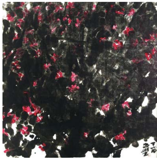
张海平《香气为谁发》 68 × 68cm

揭谛揭谛波罗揭谛波罗揭谛! ——写给张锡杰花鸟画研修班全体学员 东方瓢二千一十七年十月九日于中国威海