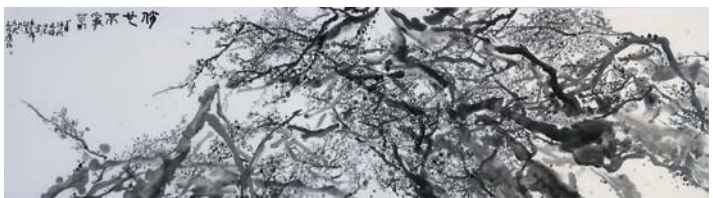
曲波《俏也不争春》 271 × 68cm

陈子冉学习感悟:当代绘画蚬蛙鼓难移吾情,唯大写意之道直追吾心,然其当备于吾心之良知,必慎独而致,体悟大瓢先生教学旨要——“摄受之法”“意化自然”。