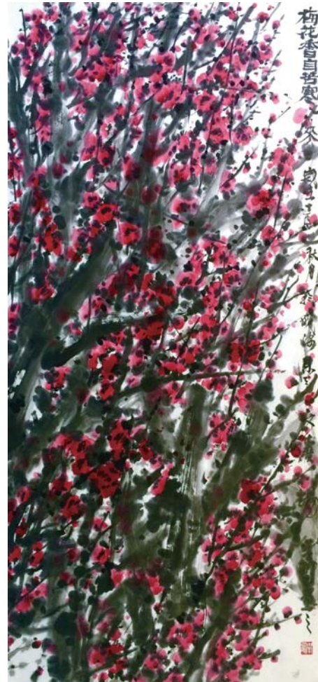
荣学鹏《梅花香自苦寒来》 136 × 68cm

刘源感悟:“写意”乃中国文化之根本,也是中国画价值之所在。“写意”与“心性”交融,永远有无数可能,令人陶醉。