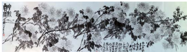
陈子冉《中秋赏菊》 271 × 68cm

张海平感言:谨记大瓢先生教导,做国学渗透于内的画家:书是法身,金石乃骨,诗文为魂。