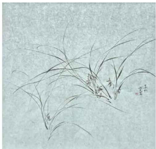
焉曙光《兰草》 68 × 68cm

曲波感悟:感恩老师教诲!此次学习悟到中国大写意花鸟画的精髓不仅仅简单地摄物象,用笔墨,大写其意,更重要的是修为,有道功夫在功夫之外,画人须以传统文化养正气、执善念,以情入书,以情入画!