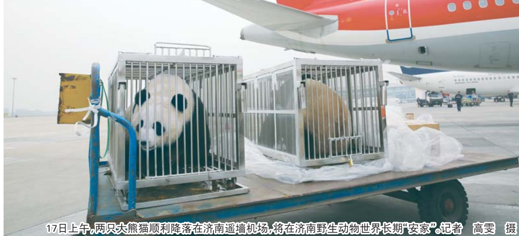
17日上午，两只大熊猫顺利降落在济南遥墙机场，将在济南野生动物世界长期“安家”。