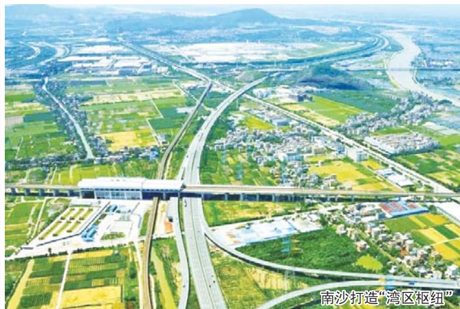
南沙打造“湾区枢纽”

聚焦大湾区共融发展的鲜活故事,还原珠三角砥砺前行推出的历史进程,广东卫视策划推出的大型专题访谈节目——《纵横大湾区》10月21日播出了第二集——南沙篇。从昔日的洋畔滩涂到如今的创新高地,南沙所焕发出的青春活力与创新魅力不禁让人惊叹,南沙新区这颗粤港澳大湾区中最耀眼的湾区明珠是如何乘湾区发展之势,解码发展之道,开启未来之门,用创新的思维与走心的理念给世人秀出一个惊艳的新南沙?