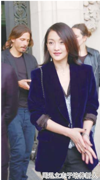
周迅立志于培养新人

班已于10月19日开启报名,只要年满16岁、没有表演专业、有志从事表演事业的民众皆可报名,名额仅限20位学生。上课地点在北京,一年学费8万人民币,不包含食宿。消息一出,即便学费惊人,但课程可以接触到演技派明星教学,不少网友都喊超想报名。