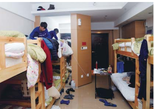
回到自己的住处,在床上收拾衣物。