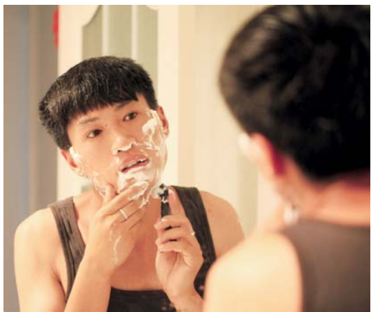
一大早就起床洗漱,精心的打扮着自己,希望给客户留个好印象。