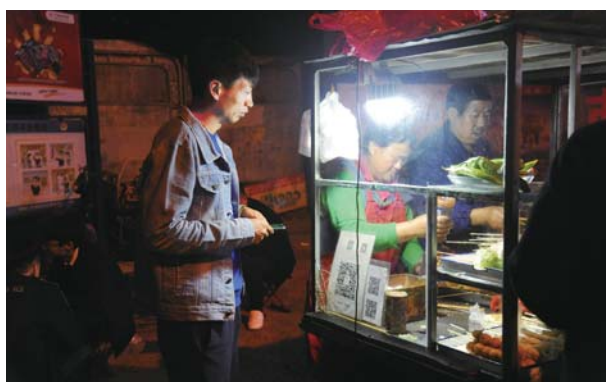
有时候回来晚了就在街边买点小吃填饱自己的肚子。