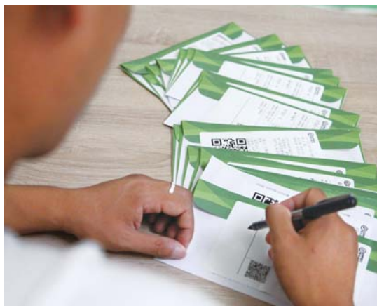
每张票证信息都需要仔细核对,以防出错,那是要扣工资的。