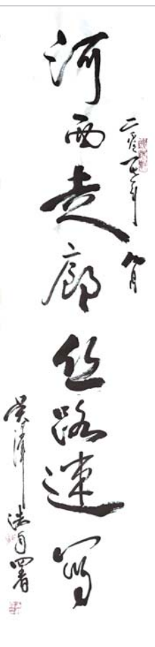
河西走廊丝路速写