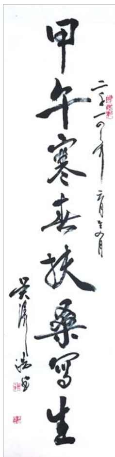
甲午寒春扶桑写生