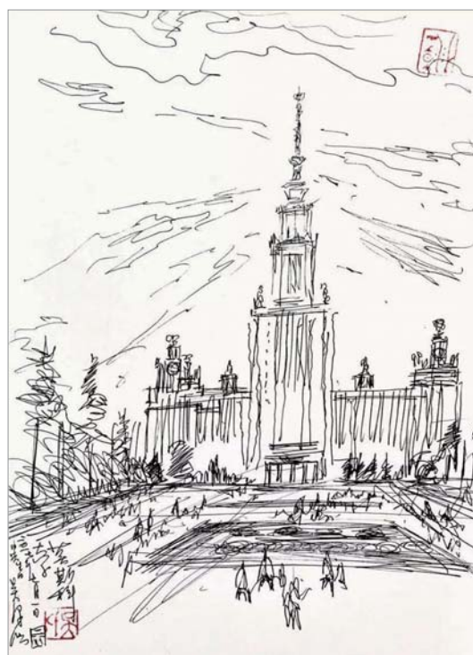
莫斯科大学速写:毛主席1957年在此向中国青年讲话