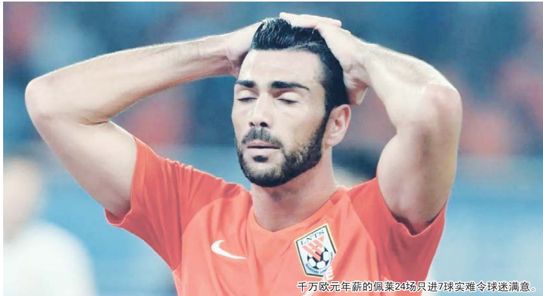
千万欧元年薪的佩莱24场只进7球实难令球迷满意。