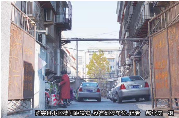
趵突泉小区楼间距狭窄,没有划停车位。