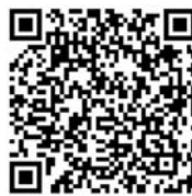
扫二维码,查看调整的门诊病种名称和鉴定标准。

职工基本医疗保险普通门诊统筹免费使用的基本药物增加治疗高血压的氢氯噻嗪(双氢克尿噻)片和治疗糖尿病的格列吡嗪片。此外,一个医疗年度内,免费药物金额累计不超过120元调整为累计不超过240元。