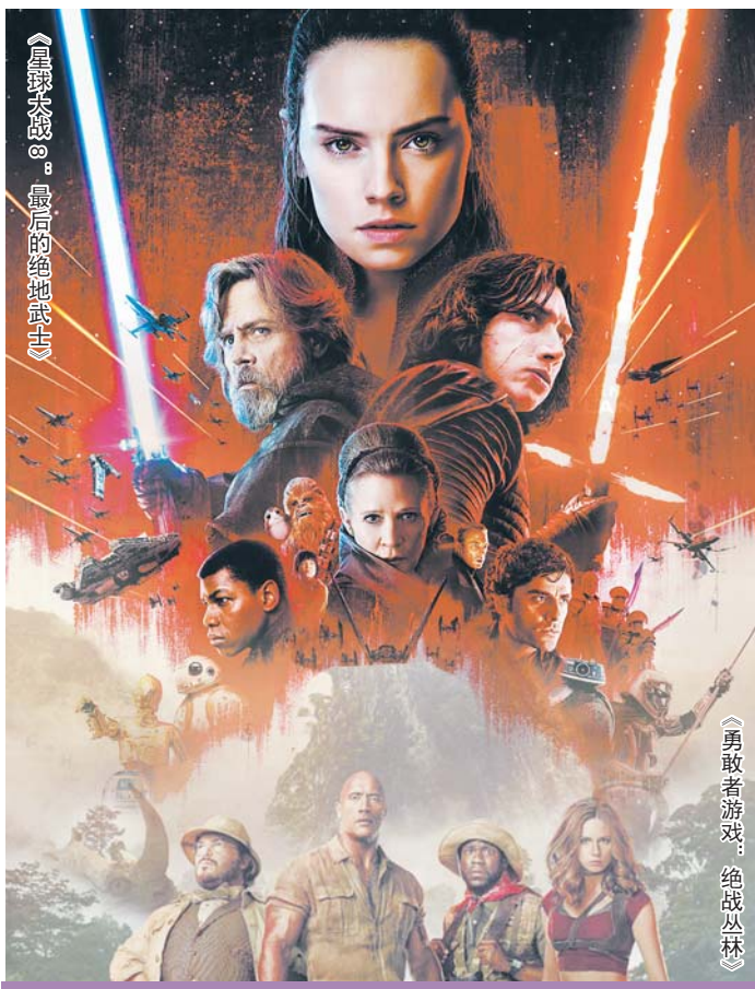
《星球大战8：最后的绝地武士》