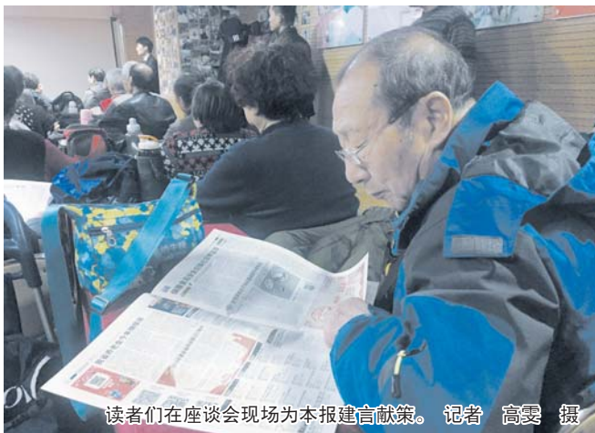
读者们在座谈会现场为本报建言献策。