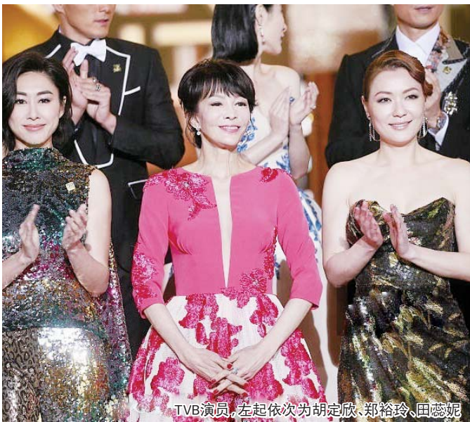
TVB演员,左起依次为胡定欣、郑裕玲、田蕊妮