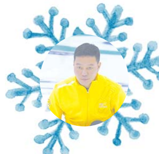
中国第一批冰壶运动员王志强