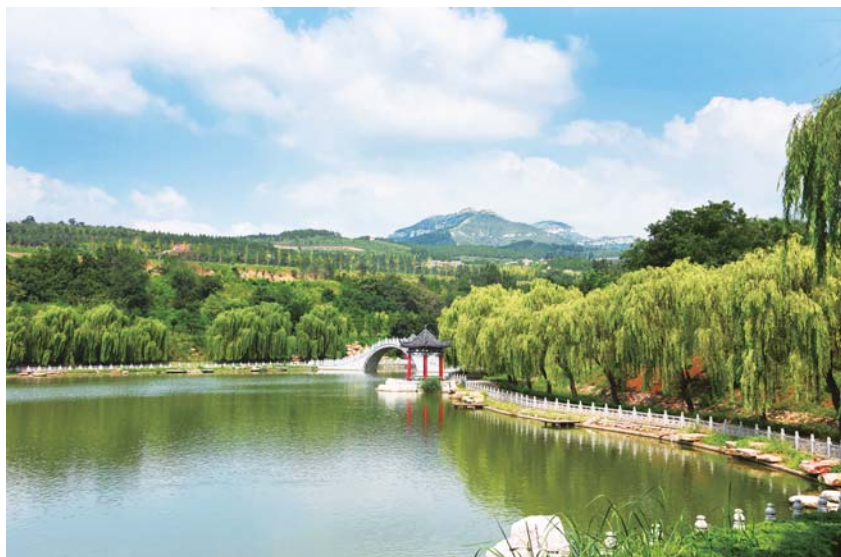
绿水青山九龙峪

青州,为古“九州”之一。总面积1569平方公里,现辖4个街道、8个镇和1个省级经济开发区,人口94.5万,有汉、回、满等多个民族,少数民族人口2.7万。是国家历史文化名城、国家卫生城市、国家园林城市、中国优秀旅游城市、中国长寿之乡,荣获中国人居环境奖,连续六次被表彰为“全国民族团结进步模范集体”。