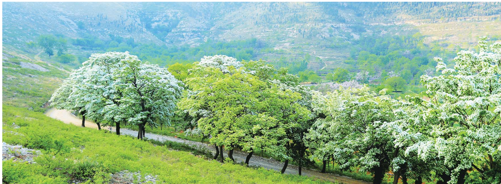
流苏时节