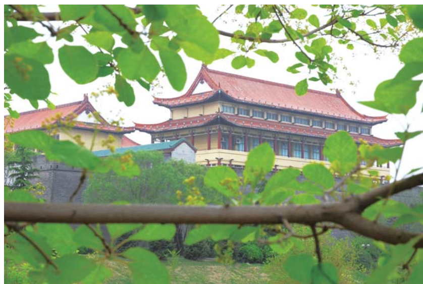
绿染古城