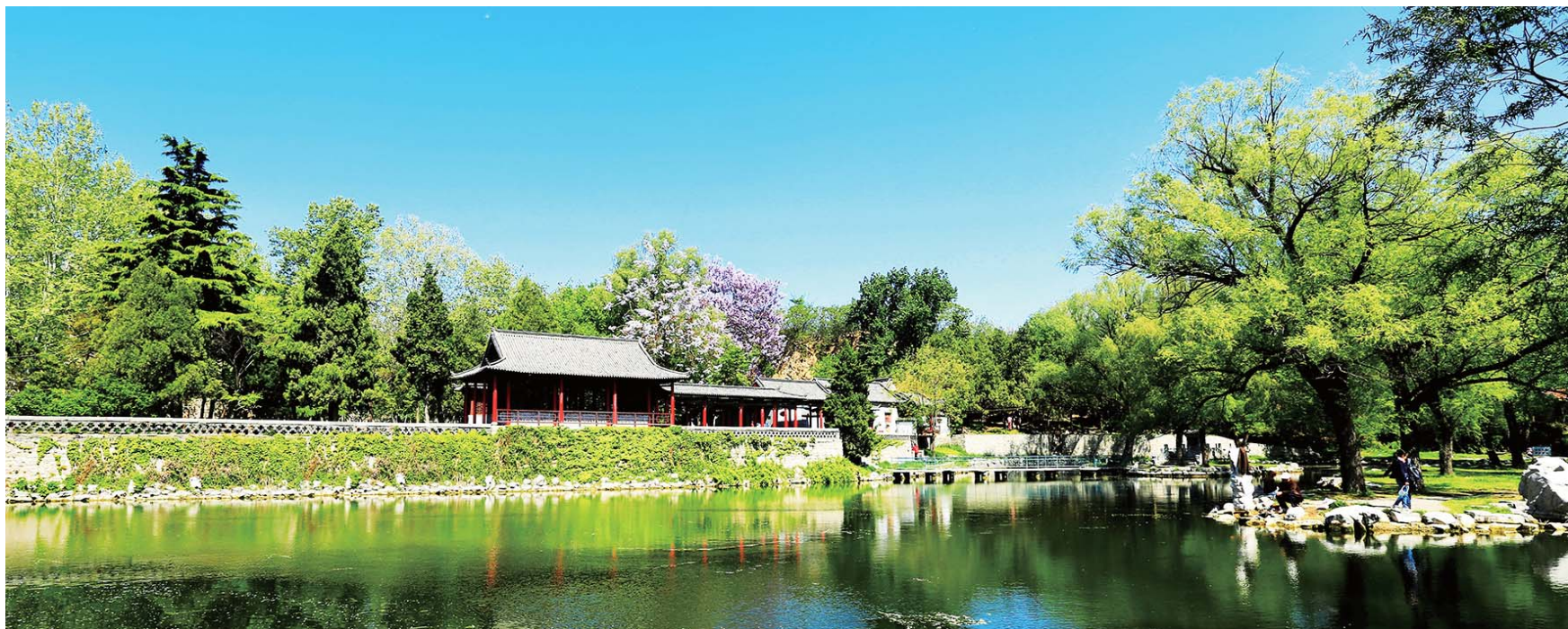
绿意顺河楼