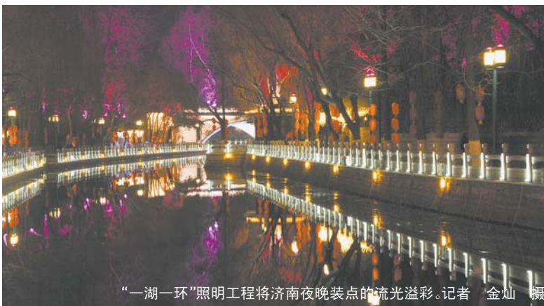
“一湖一环”照明工程将济南夜晚装点的流光溢彩。记者 金灿 摄

夜幕降临，济南大明湖沿岸和护城河畔流光溢彩、绚丽夺目。自“一湖一环”景观照明工程亮灯以来，大明湖景区和环城公园人流量增加，济南的夜晚变得热闹起来，尤其是在节假日期间，不少外地游客特地赶来欣赏济南“荷形柳意”的灯光景致。据济南市统计局、济南市旅游发展委员会调查统计数据显示，在春节假期七天内，天下第一泉景区共接待游客105万人次，其中大明湖景区接待62万人次。