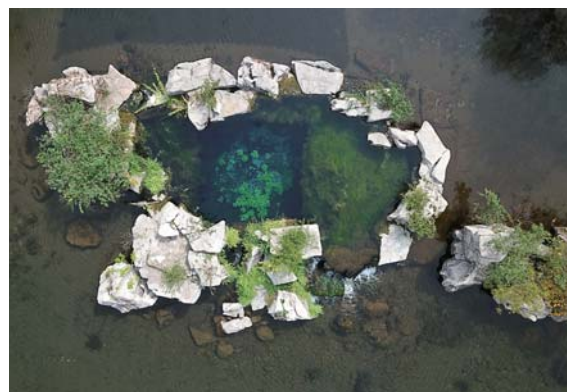
五莲泉清澈透底,碧水荡漾。