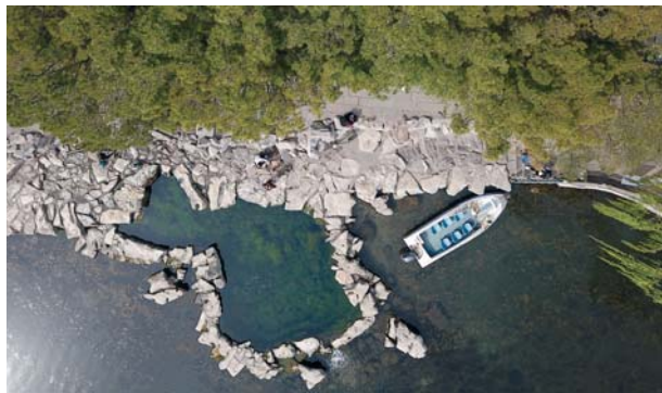
白石泉边的自然石造型各异,形态独特。