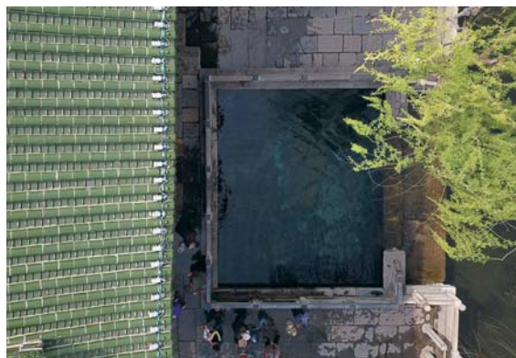
琵琶泉与“清音阁”相映成趣。