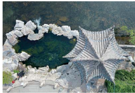
九女泉中的细流从石缝泄入河内。